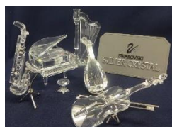
Photo d'instruments de musique, transparents, non contractuelle.